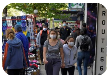
Personas físicas (IRPF)