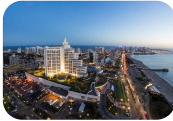
IVA 10% Servicios de alojamiento prestados por hoteles, servicios de salud, ventas de paquetes turísticos efectuados por agencias o mayoristas, transporte terrestre de pasajeros, etc.