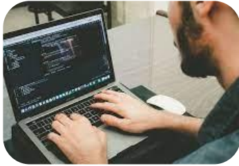
IVA 22% Régimen General