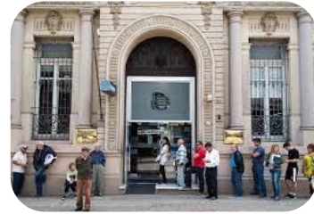
IVA Exento Operaciones bancarias, juegos de azar, servicios de aeroplación de productos químicos, seguros y reaseguros, etc.